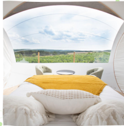
Bulle au milieu des vignes

BubbleTree a inventé un nouvel univers pour des séjours insolites en y associant design, innovation, simplicité et confort. De quoi créer des lieux de séjours insolites ou atypiques pour y vivre une expérience privilégiée.